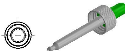
Tabella dati tecnici / Technical data table / Tableau données techniques