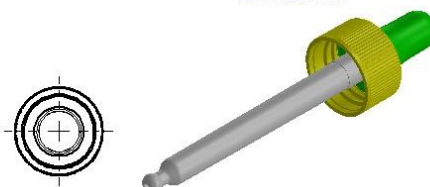
Tabella dati tecnici / Technical data table / Tableau données techniques